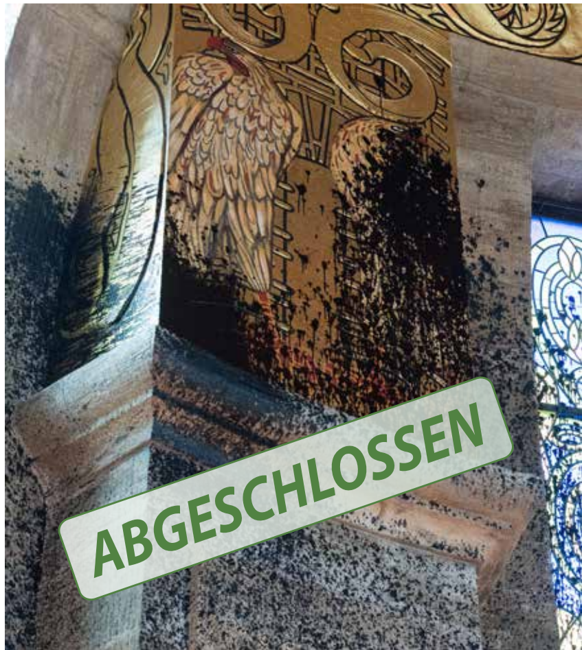
Das Deckengemälde „Die Götterdämmerung und die Wiedergeburt“ von Prof. Gußmann wurde durch einen Teeranschlag im Oktober 2019 (siehe Abbildung) beschädigt.

Kosten für die Wiederherstellung rd. 15.000,-€ geplante Umsetzung: bereits umgesetzt