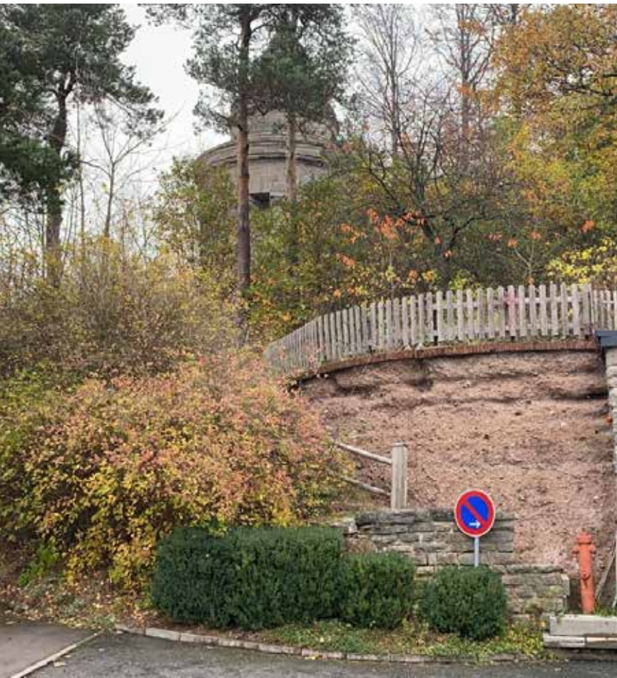
Wandern, Denkmalbesuch und Rasten bei lokaler Bewirtung.

Direkt unterhalb des Denkmals und neben dem Hoteleingang steht diese baufällige Stützmauer. Darüber befindet sich ein heute noch wild bewachsenes Plateau mit direktem Blick auf die Wartburg. Nach der statischen Stabilisierung der Mauer soll dort eine Terrasse zwecks zusätzlicher Bewirtungseinrichtung entstehen. Durch die besonders im Sommer zunehmenden Besucherzahlen des Burschenschaftsdenkmals und damit verbunden die Zunahme der Gäste im Restau-