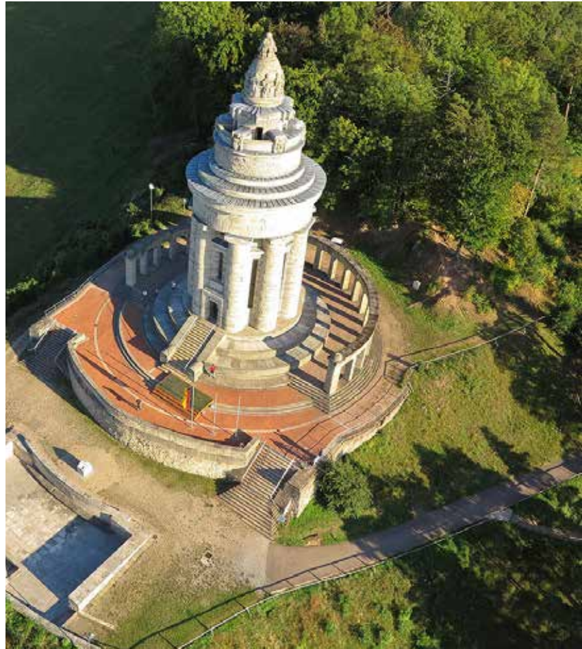
Die geplante Komplettierung der Grünanlagen um das Denkmal.

Kosten für die Neugestaltung rd. 5.000,-€ geplante Umsetzung: unbekannt