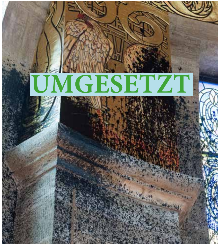
Das Deckengemälde „Die Götterdämmerung und die Wiedergeburt“ von Prof. Gußmann wurde durch einen Teeranschlag im Oktober 2019 (siehe Abbildung) beschädigt.

Kosten für die Wiederherstellung rd. 15.000,-€ geplante Umsetzung: bereits umgesetzt